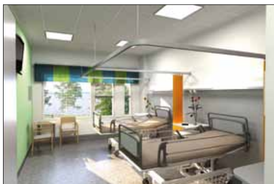
KAHDEN HENGEN POTILASHUONE